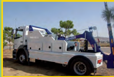
REMOLCADORES PARA VEHÍCULOS PESADOS