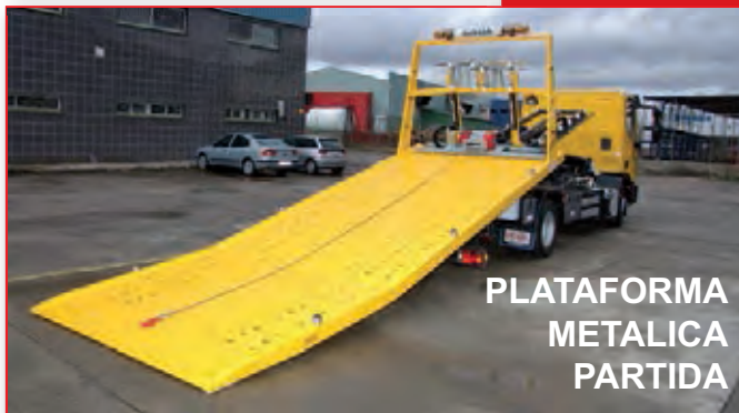
PLATAFORMA METALICA PARTIDA