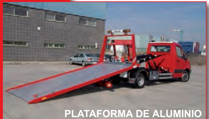
PLATAFORMA DE ALUMINIO