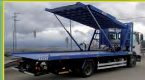
PLATAFORMA PARA 2 Ó 3 VEHÍCULOS

Cualquier otro producto que este interesado y no lo vea en esta información no dude en consultar.