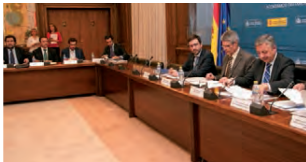
A la derecha el Ministro Blanco, con nuestros representantes al fondo de la imagen.

El Ministro José Blanco, que escuchó atentamente todas nuestras solicitudes, tomó nota de las mismas, dejando encargado al Director General de Transportes Terrestres, allí presente, del estudio y, en su caso, ejecución de las mismas.