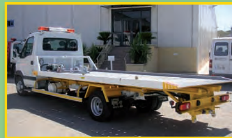
PLATAFORMA A GUSTO DEL CLIENTE

DISPOSITIVOS DE ARRASTRE O CUCHARAS BIEN PARA CAMIONES LIGEROS O PESADOS