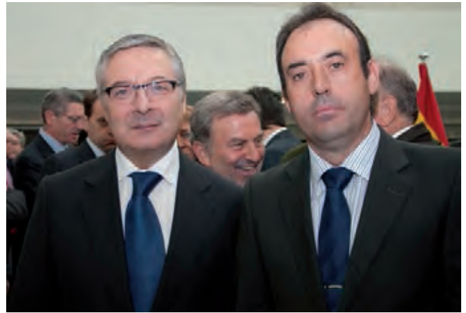
El Presidente de AMEAC con el Ministro de Fomento.

Este nuevo proyecto generará cerca de 85.000 empleos para la Comunidad de Madrid y un movimiento de 5.200 millones de euros