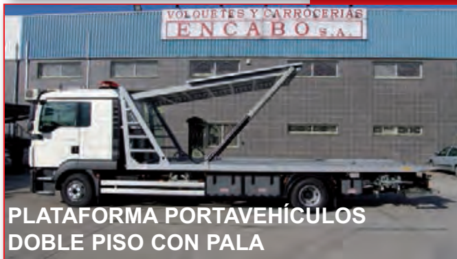
PLATAFORMA PORTAVEHÍCULOS DOBLE PISO CON PALA