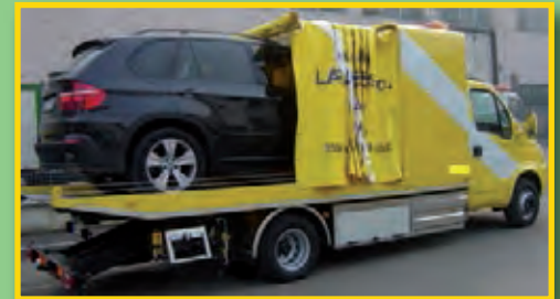
PLATAFORMA CON SISTEMA CORREDERA