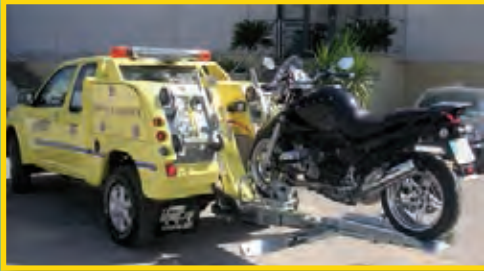
REMOLCADOR 4X4 DE VEHÍCULOS Y MOTOS