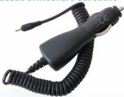
CARGADOR desde el mechero del coche