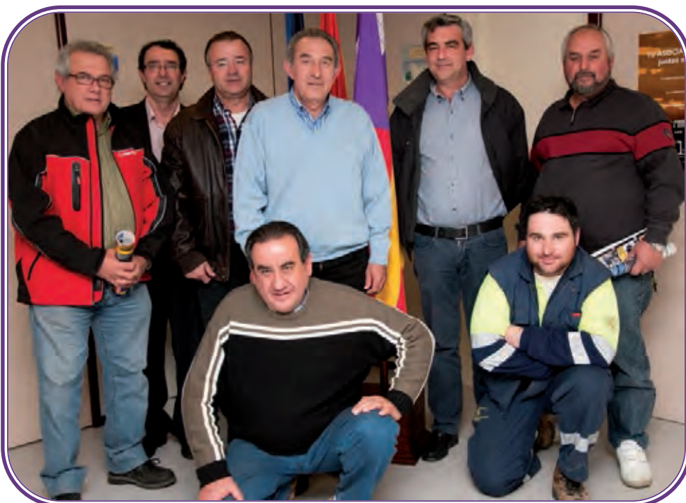
Varios socios de ABEAC posan en su sede tras una asamblea informativa.