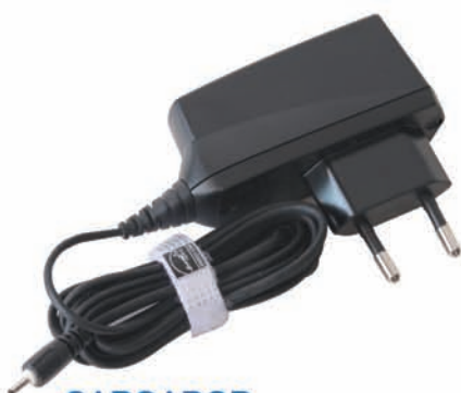
CARGADOR desde toma de corriente