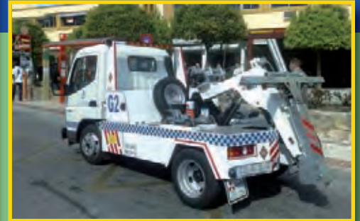
REMOLCADOR CHASIS PARA AYUNTAMIENTOS