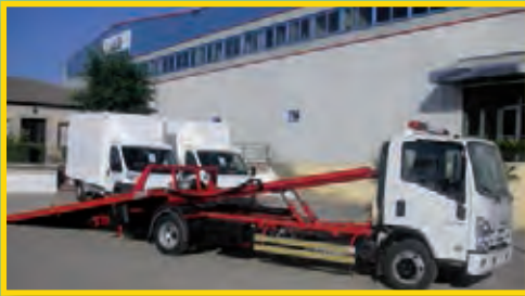
PLATAFORMAS PORTAVEHICULOS CON ARTICULACION TRASERA