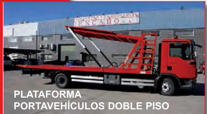
PLATAFORMA PORTAVEHÍCULOS DOBLE PISO