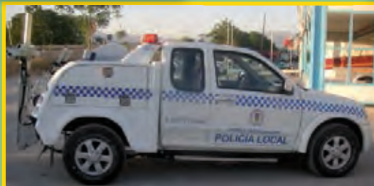
REMOLCADOR 4X4 PARA AYUNTAMIENTOS