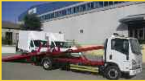
PLATAFORMAS PORTAVEHICULOS CON ARTICULACION TRASERA