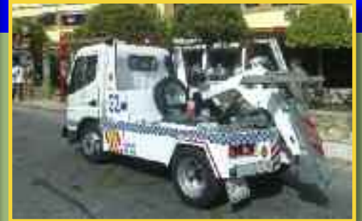
REMOLCADOR CHASIS PARA AYUNTAMIENTOS