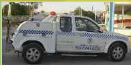
REMOLCADOR 4X4 PARA AYUNTAMIENTOS