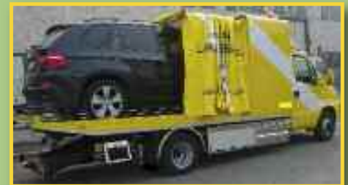
PLATAFORMA CON SISTEMA CORREDERA