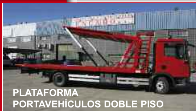
PLATAFORMA PORTAVEHÍCULOS DOBLE PISO