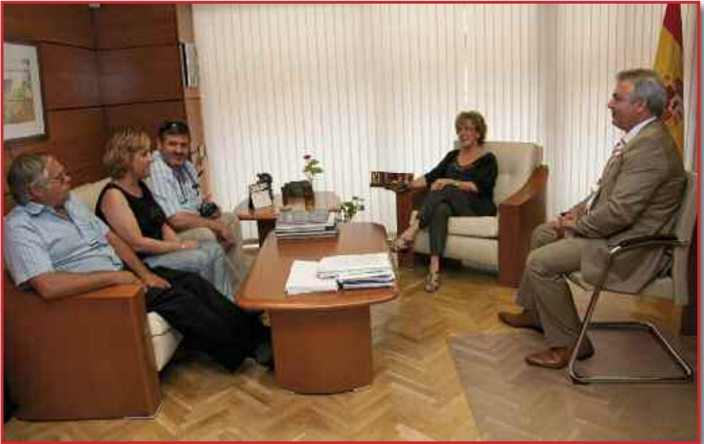
La Directora conversa con los responsables de AVEAC y nuestro Presidente.

—Las peculiaridades tanto de Valencia, provincia, como de la Comunidad Valenciana en su conjunto destacan el volumen de desplazamientos que genera el turismo tanto nacional como de otros países, la ubicación geográfica de nuestra Comunidad en el centro del Corredor del Mediterráneo, son factores a tener presentes siempre en la gestión y regulación del tráfico, por citar un dato; el porcentaje de desplazamientos de largo recorrido sobre el total nacional se sitúa alrededor del 21% (sin contar con los desplazamientos generados por la actividad laboral y diaria de nuestro entorno).