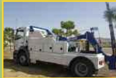
REMOLCADORES PARA VEHÍCULOS PESADOS