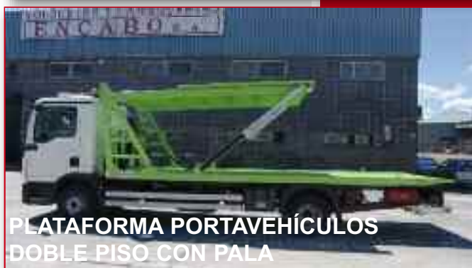
PLATAFORMA PORTAVEHÍCULOS DOBLE PISO CON PALA