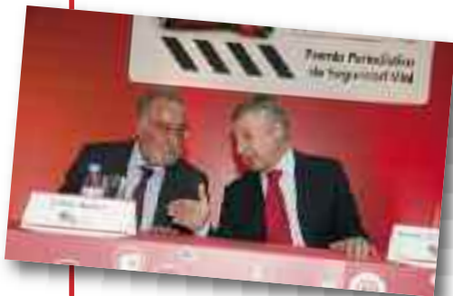
Pere Navarro y el Ministro José Blanco.