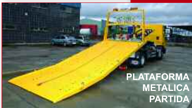
PLATAFORMA METALICA PARTIDA