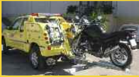
REMOLCADOR 4X4 DE VEHÍCULOS Y MOTOS

RAMPAS MANUALES E HIDRAULICAS PARA EL TTE. DE MOTOS CON CABESTRANTES, SOPORTE DE RUEDA DELANTERA, ETC.