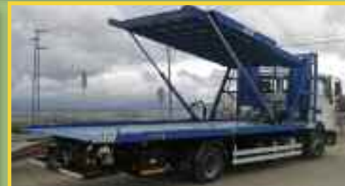
PLATAFORMA PARA 2 Ó 3 VEHÍCULOS

Cualquier otro producto que este interesado y no lo vea en esta información no dude en consultar.