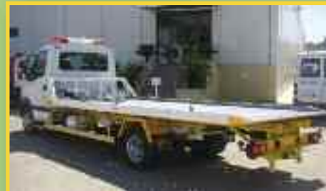
PLATAFORMA A GUSTO DEL CLIENTE

DISPOSITIVOS DE ARRASTRE O CUCHARAS BIEN PARA CAMIONES LIGEROS O PESADOS