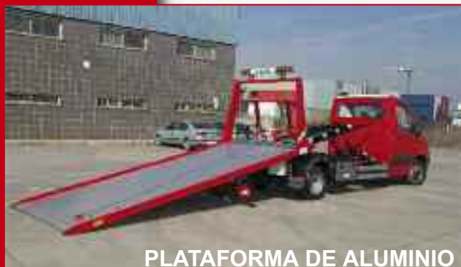
PLATAFORMA DE ALUMINIO