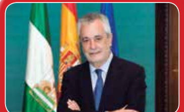
José Antonio Griñán, Presidente de la Junta de Andalucía