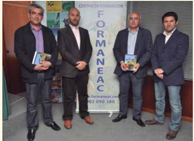
Los responsables de FORMANEAC posan con el manual.

Esta formación se empezará a impartir en todas las comunidades del territorio nacional.