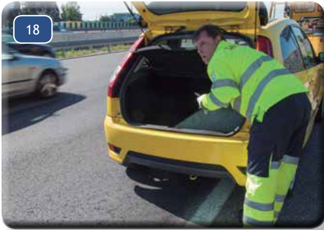
ESTA ES LA FORMA CORRECTA DE RECOGER LA ANILLA.