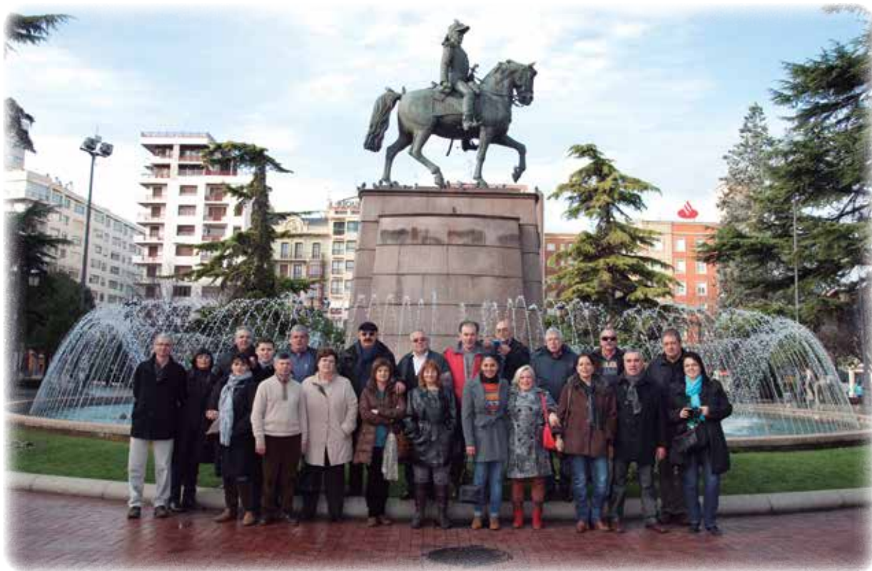
Nuestros socios y amigos posan en la fuente del General Espartero en el Espolón de Logroño.