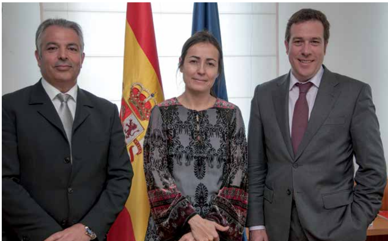
La Directora General entre el Presidente de ANEAC-FENEAC y nuestro abogado y Secretario Técnico

que cuando se han hecho estas propuestas de standarización se han elegido colores que también formaban parte ya de la identidad corporativa de otra empresa, por lo tanto lo que ha habido es reticencia por parte de otras empresas a standarizarse. Por este motivo pienso que la solución sería que el servicio de Auxilio en Carretera escogiera un color que nadie hubiera usado en el pasado.