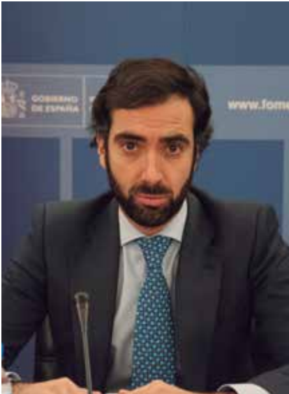
El Director General de Transporte Terrestre, Joaquín del Moral.

diciembre de 2011 (1,2952€/l) el precio del gasóleo se ha incrementado un 50%. Este año se ha superando su récord histórico a lo largo de los meses, hasta situarse en 1,433 €/l el pasado mes de septiembre.