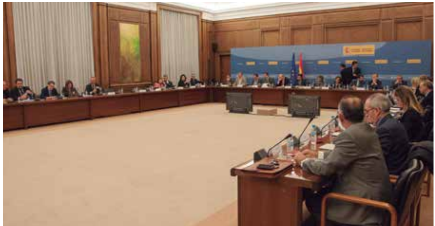
Imagen de la sala donde tuvo lugar la reunión anual.

Estos y otros importantes temas que afectan al sector, fueron abordados en la ya tradicional reunión anual del Comité con los Directores Generales de Transporte.