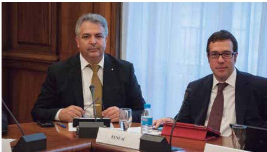
FENEAC estuvo representado por su Presidente y por el Secretario Técnico.