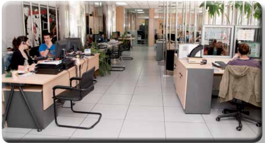
Eurolloyd dispone en Madrid de unas modernas y amplias instalaciones.

Que haya competencia siempre es importante, lo es para el cliente porque le permite comparar y en muchas ocasiones comprar más barato y lo es para nosotros porque nos obliga a ser cada día mejores. Por nuestra manera de trabajar la competencia nos observa y cuando cree que nuestro planteamiento ha sido correcto suele salir al mercado, aunque