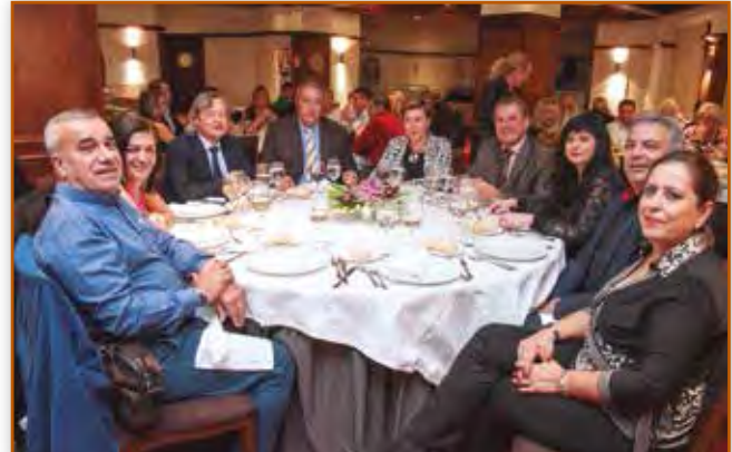
La Jornada se prolongó hasta bien entrada la noche.