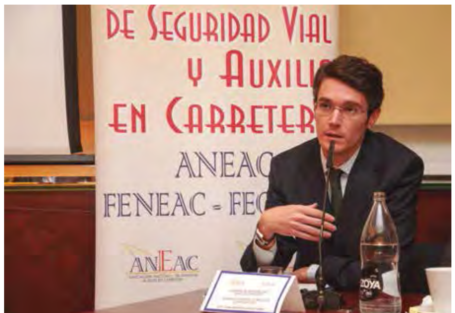
El Subdirector General durante su intervención.