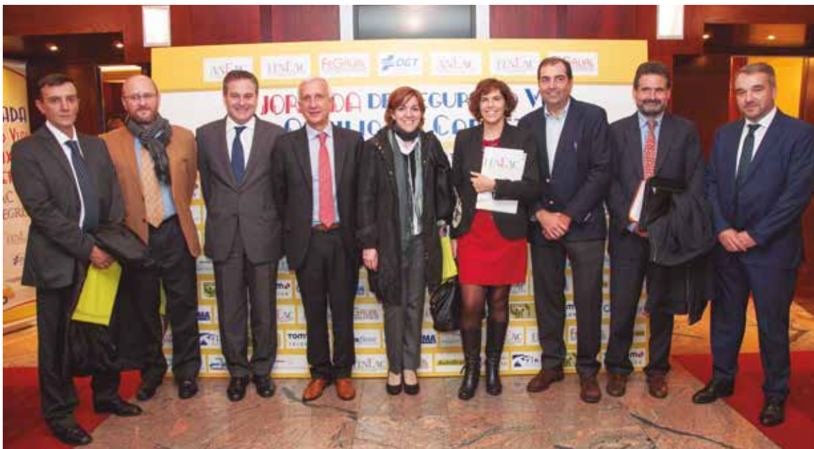
Los representantes de las compañías posan junto al photocall de la Jornada.

ronel Jefe de Operaciones, quien intervendría más tarde. "El objetivo máximo -subrayó-, es mejorar las condiciones de seguridad en la que se desarrolla este trabajo, que sin duda tiene peligrosidad porque se realiza en la vía". También destacó la importancia de retirar los vehículos de la vía lo antes posible, que choca frontalmente con las reparaciones in situ , que serán tratadas como situaciones excepcionales.