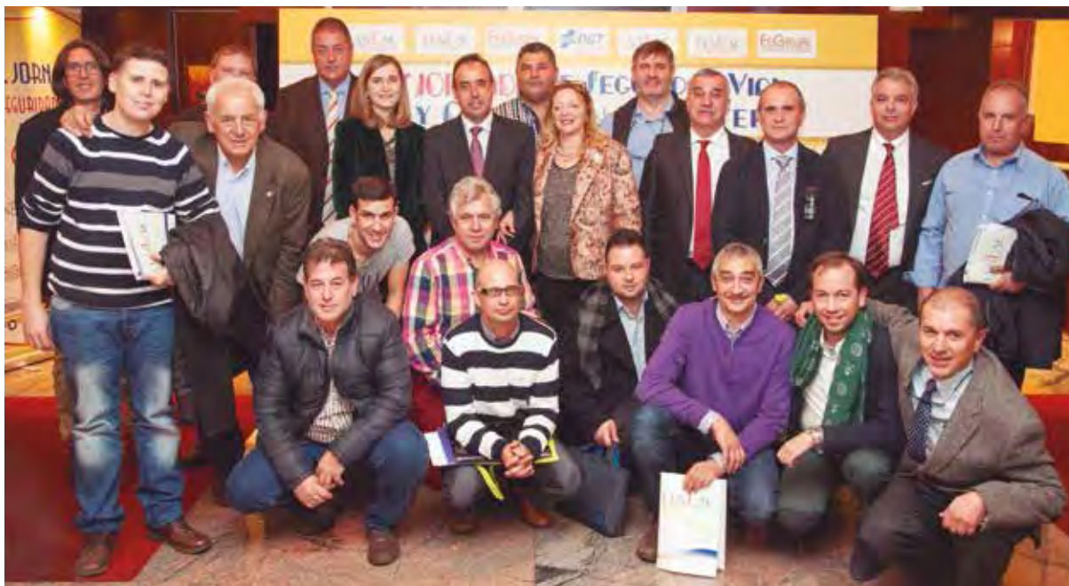
Socios y organizadores pasaron junto al photocall.