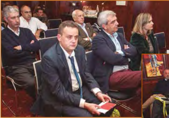
La Asamblea fue seguida con atención por los socios asistentes.