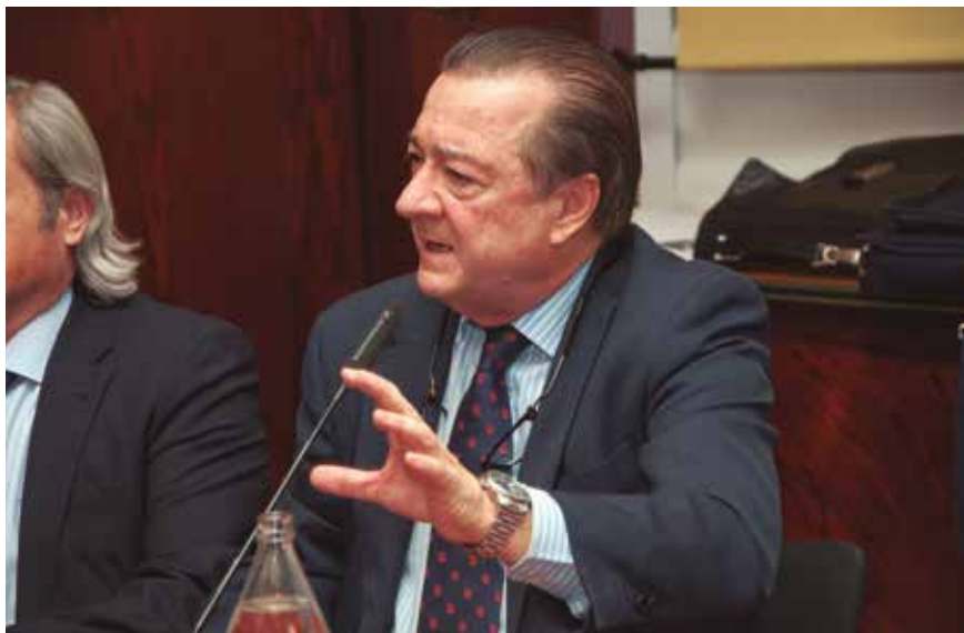
El Fiscal durante su ponencia.

"Como Fiscal Delegado en Seguridad Vial, pienso que habéis avanzado pero falta mucho camino por recorrer. El Protocolo que