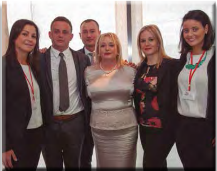
Familia, amigos, clientes y colaboradores, todos se dieron cita en la fiesta de Aniversario.