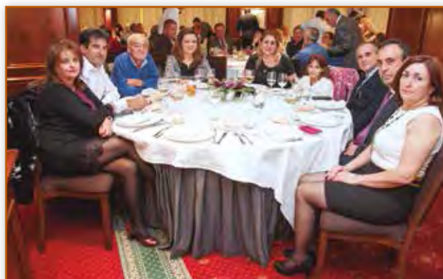
Tras la Asamblea tuvo lugar la tradicional cena de Navidad.