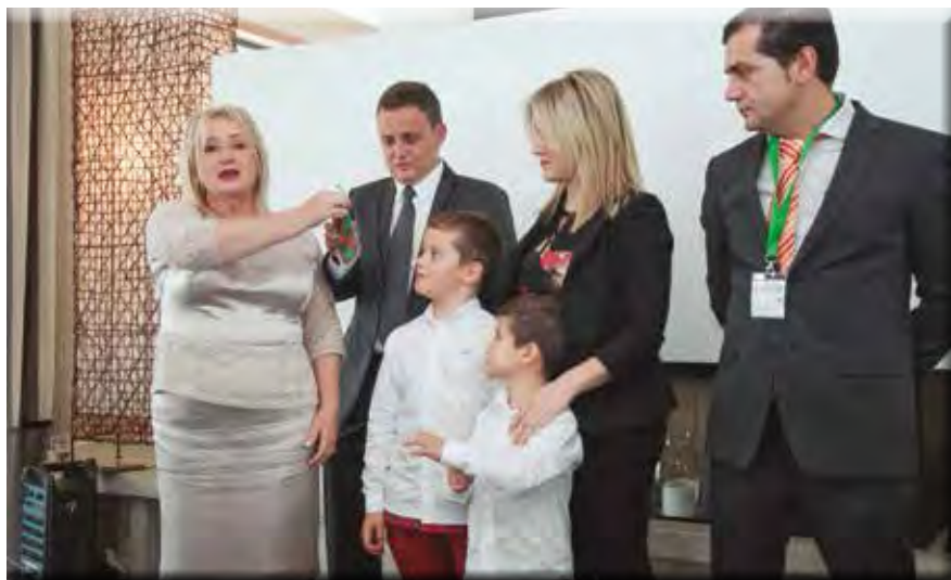
Diana en un acto simbólico, entrega las llaves de la empresa a sus hijos.

y la consideración de sus clientes. Sin duda es la número uno en Vigo y referente además como empresa moderna que ha sabido evolucionar con el paso del tiempo.