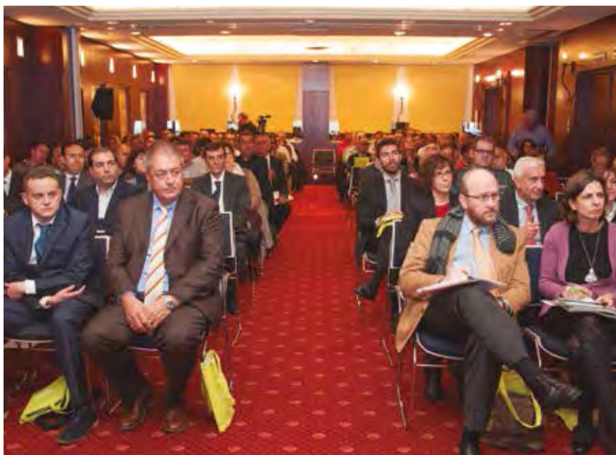
Las previsiones de asistencia fueron superados, teniendo que habilitar otra sala.