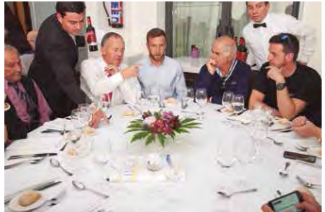
Finalizada la Jornada, ANEAC-FENEAC y FEGRUAL, invitaron a todos los asistentes a un almuerzo en el Hotel Pullman Airport &Feria.