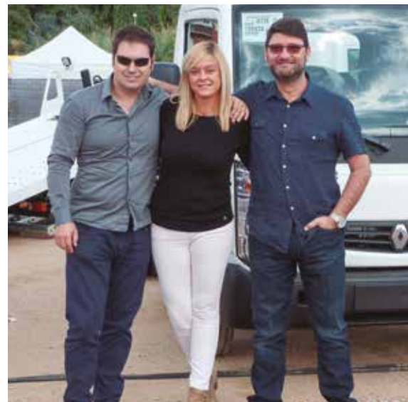
Representantes de Renault en la Feria.