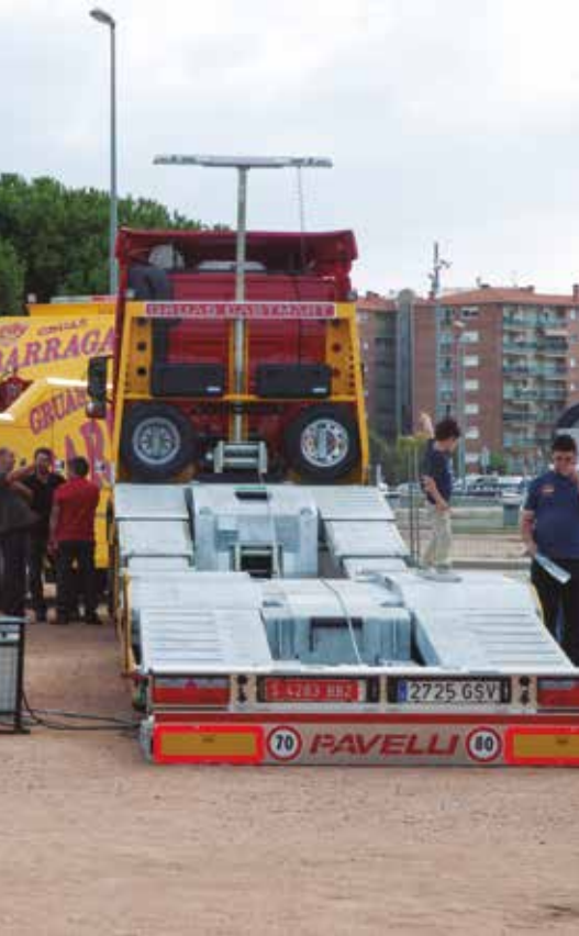
Pavelli llevó a esta nueva edición de la Feria, productos innovadores de la máxima calidad.

sultor, conferencista y desde hace más de 20 años, asesor de empresas en todo el mundo, para que puedan transformar sus negocios. Actualmente es Presidente de la Fundación Ineval, y también es el autor del método de "Liderazgo empresarial, motivación y seguridad en uno mismo", que inicialmente impartió de manera presencial en empresas de varios conti-