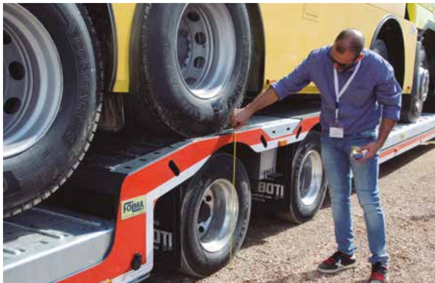
Un socio mide la altura de una góndola de Foima.