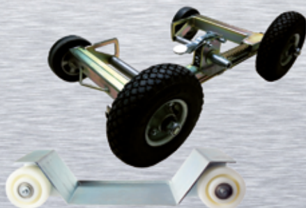
CARROS PORTA VEHÍCULOS