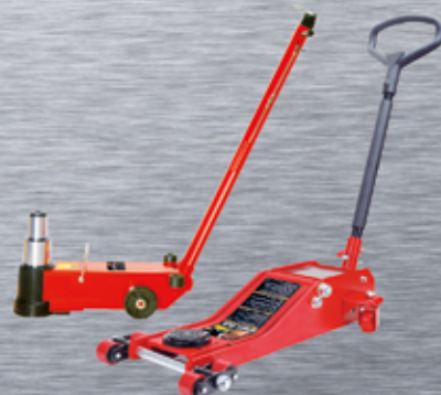
GATOS DE GARAJE