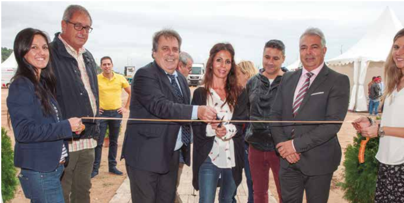
El Alcalde y la Regidora de Santa Susanna, junto al Presidente de ANEAC-FENEAC, inauguran la VII Feria.

El pasado mes de octubre tuvo lugar en Santa Susanna (Barcelona) la VII Edición de la Feria Internacional de Auxilio y Rescate en Carretera. Un encuentro que se ha convertido en referente del sector y que ha contado, en esta ocasión, con mayor presencia nacional e internacional de empresas expositoras.