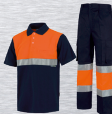
ROPA LABORAL DE ALTA VISIBILIDAD