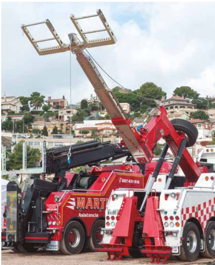
Eurogrúas aportó estos espectaculares remolcadores.