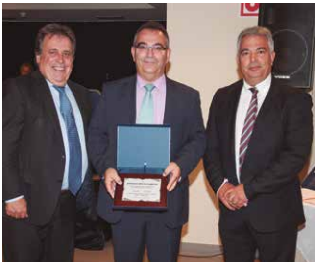
El Coronel José Luis Tovar, recibiendo una placa de reconocimiento a la Agrupación de Tráfico de la Guardia Civil.

Cerraelx: Debutante en la Feria, esta empresa ilicitana obtuvo el Premio a la Innovación de la VII Feria Internacional de Auxilio y Rescate en Carretera. Venden herramientas de precisión para la apertura de vehículos, pero lo más importante son sus cursos de formación 100% prácticos. Desde el primer momento, tras pasar por sus cursos, ampliarás tu abanico de actividades como auxilio en carretera. ¿Cuántas veces hemos tenido que ir a abrir un coche por el extravió de sus llaves? Ahora gracias a