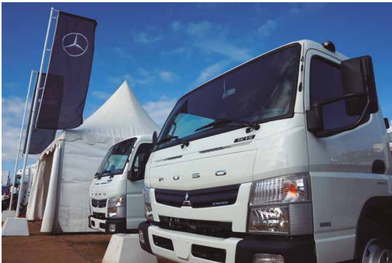
Fuso, de la mano de Mercedes. La mejor garantía.