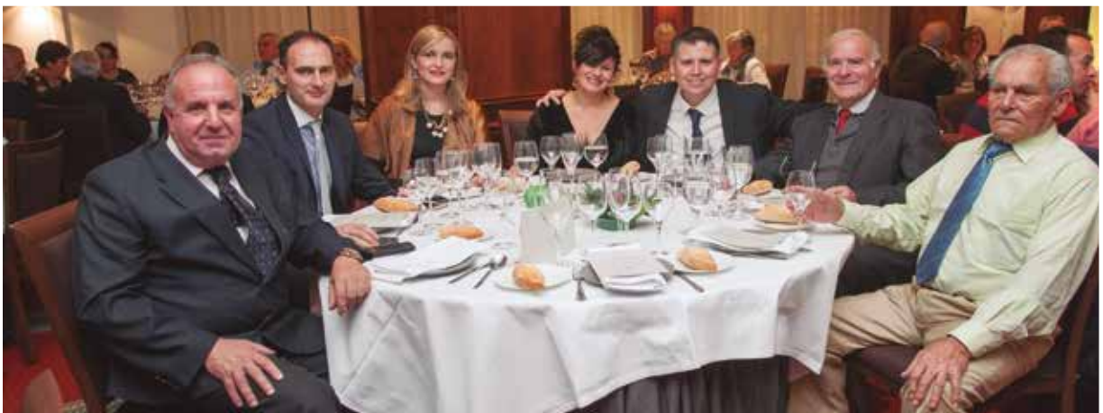
Tras la asamblea tuvo lugar la tradicional cena de Navidad.