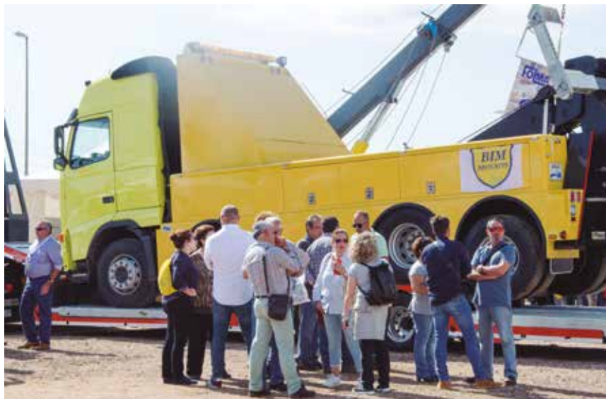
La VII edición recibió numerosos visitantes.