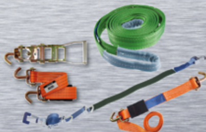
ELEVACIÓN Y AMARRE