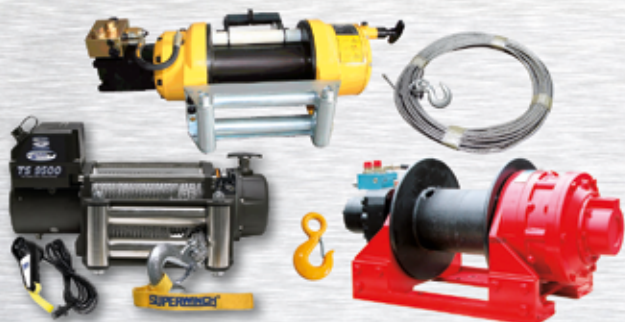
CABRESTANTES ELÉCTRICOS / HIDRÁULICOS