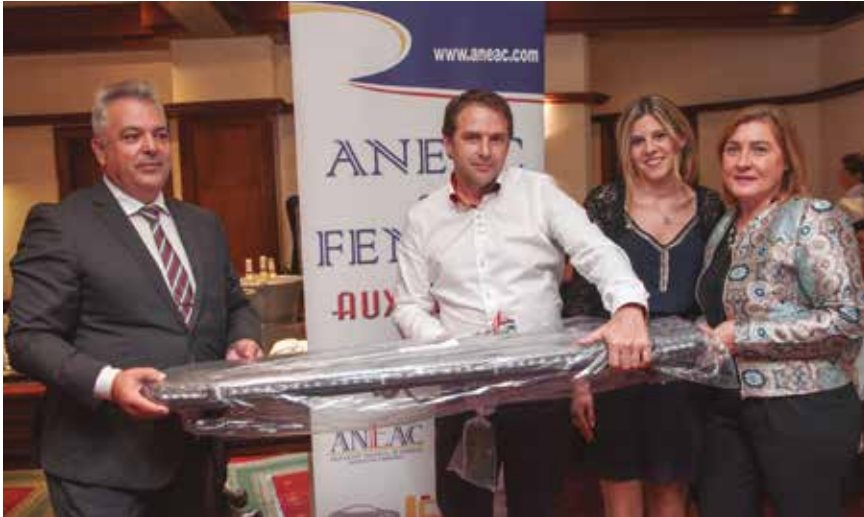
Entrega del puente de luces, donado por AVEIMASTER, al ganador del sorteo.