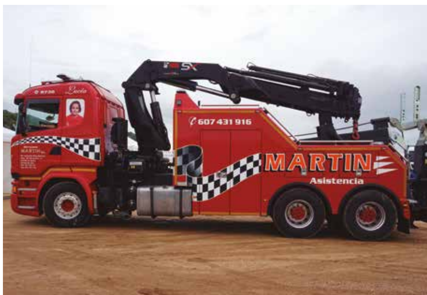
Imagen de un impresionante remolcador.