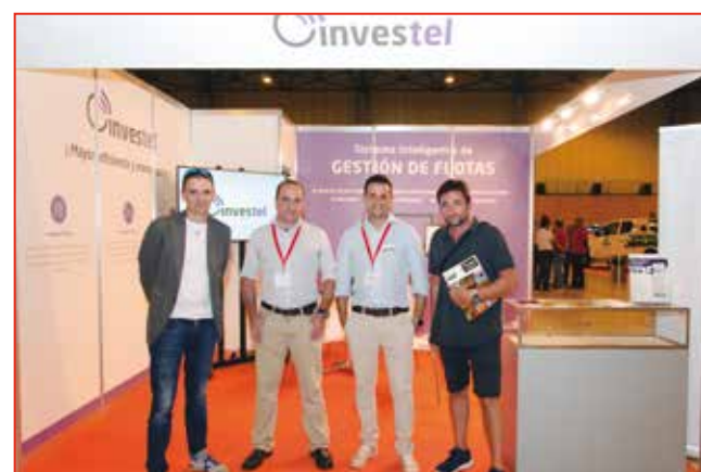
INVESTEL también estuvo presente en FIRECA.