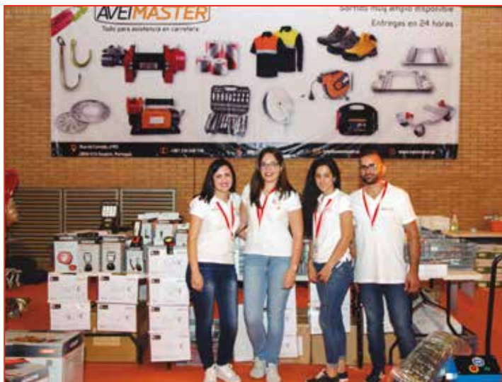
El equipo de Aveimaster posa en el stand de FIRECA.