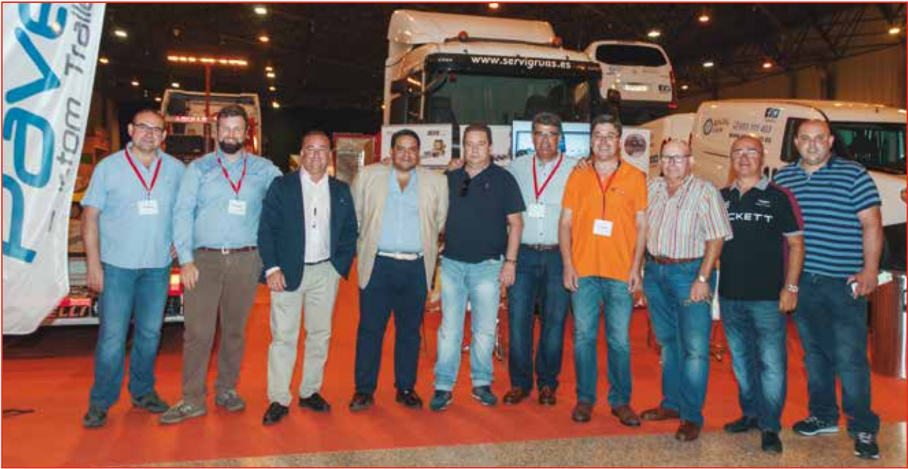
Organizadores y expositores posan en el recinto ferial.