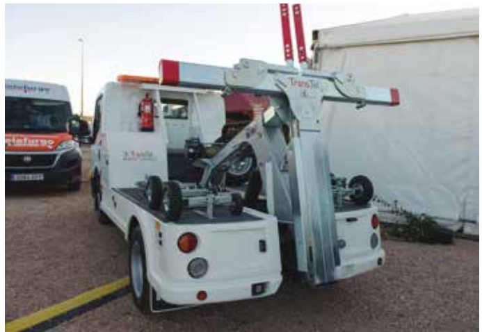
Grúa de TransTel.