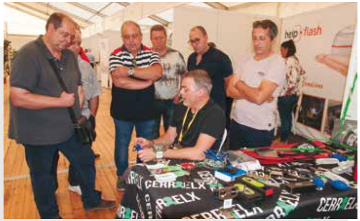
El stand de cerraelx fue muy visitado.