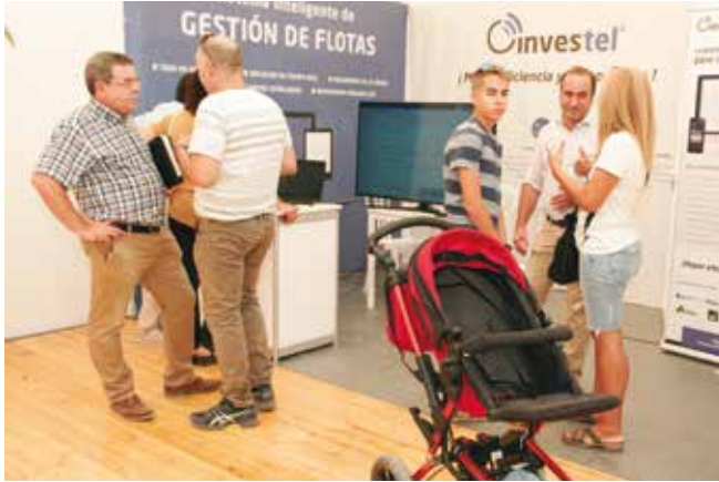
El stand de INVESTEL fue muy visitado.