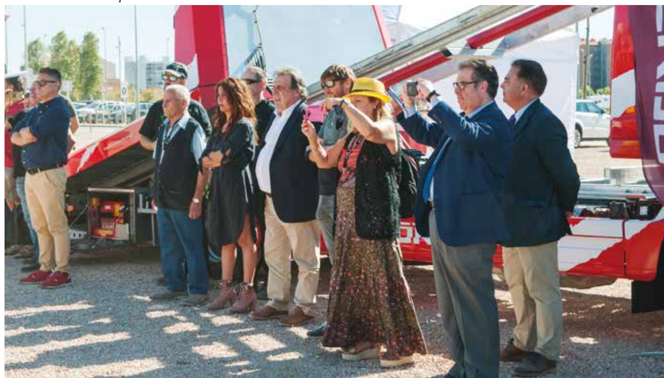
Nadie quiso perder detalle del simulacro