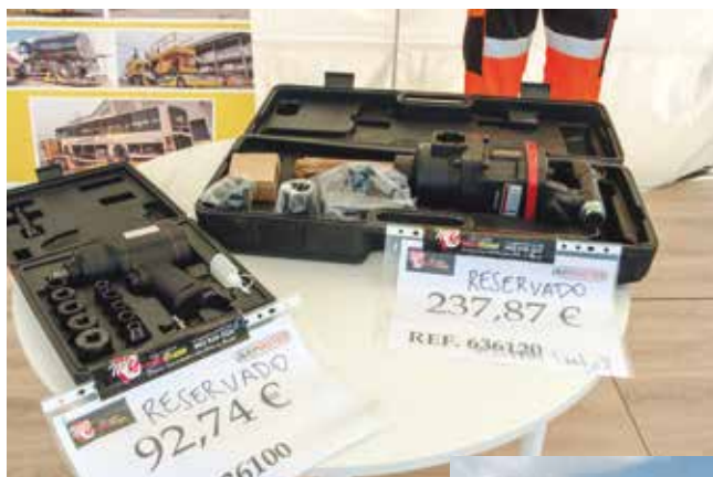
Diferentes ofertas en el stand de Medicrane.