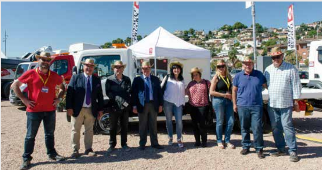
Posando con sombreros al más puro estilo "vaquero", obsequio de Renault.