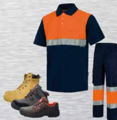
ROPA LABORAL DE ALTA VISIBILIDAD