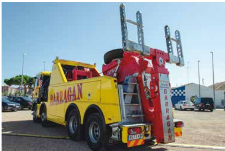
Remolcador fabricado por Omars.