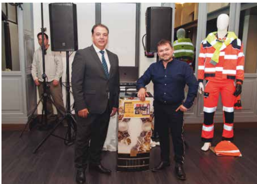
Nuestro presidente entregando la cesta de Navidad al afortunado ganador.