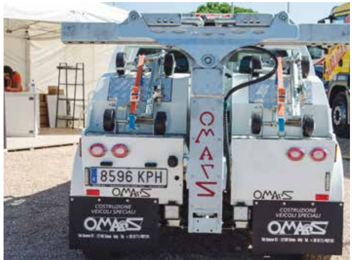
Detalle de grúa de Omars.