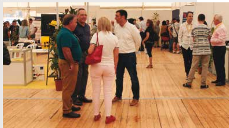
Interior de la feria de Santa Susanna.