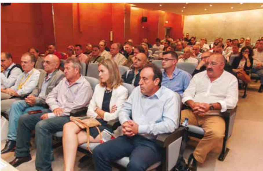
La afluencia a la III Jornada fue muy numerosa.