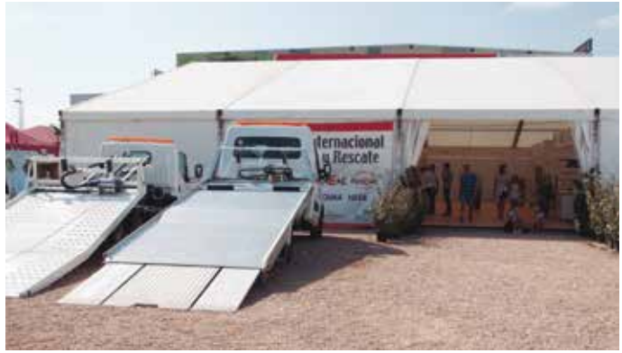
Imagen de la carpa con varias grúas de Foima.