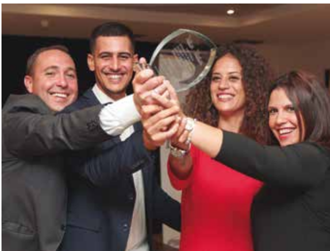
El equipo de Work-Men celebran el premio a la innovación.