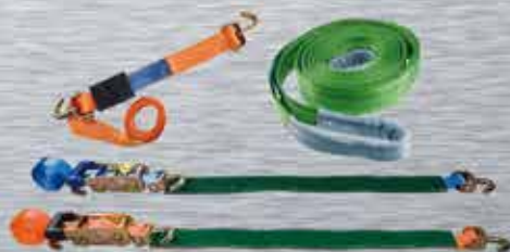
ELEVACIÓN Y AMARRE