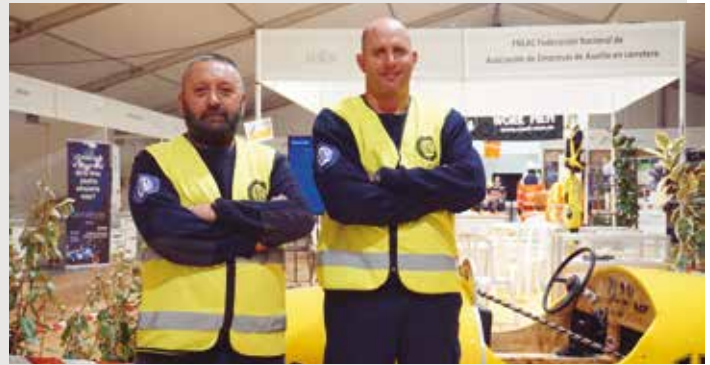
Miembros de seguridad de la feria.