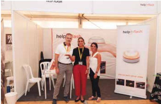
El equipo de help+flash.