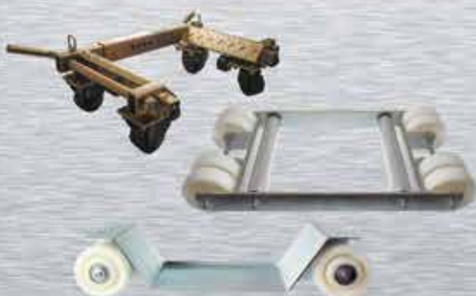
CARROS PORTA VEHÍCULOS