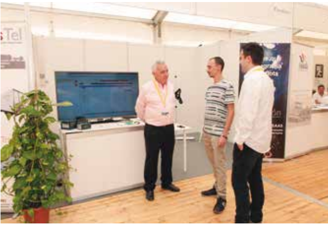
Stand de Camaleón.