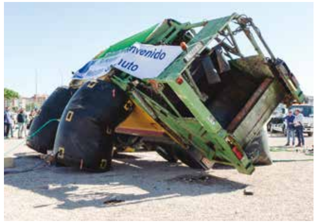
Desvuelvo mediante colchones neumáticos.