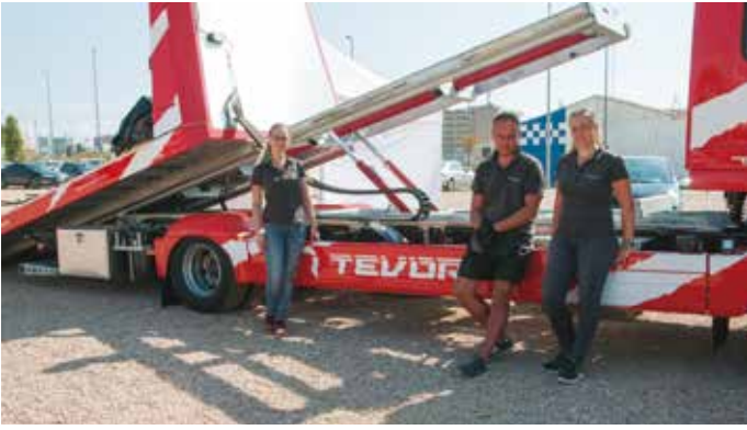
El equipo de Tevor con una de sus grúas.