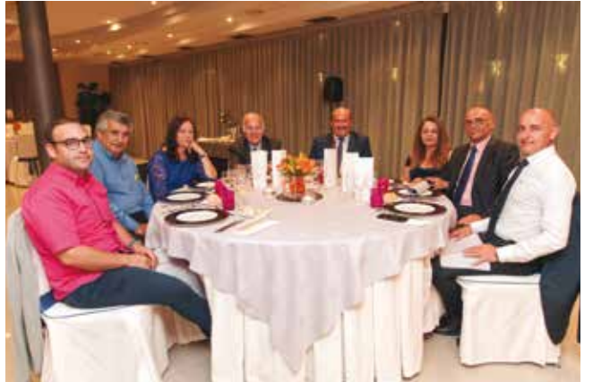
Como viene siendo habitual, la feria terminó con la tradicional cena de gala.