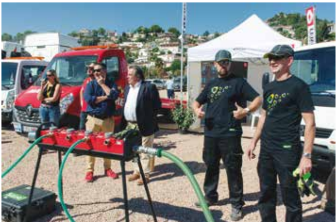
Los responsables de Trelleborg Slovenija, satisfechos del resultado de su sistema de desvuelco.