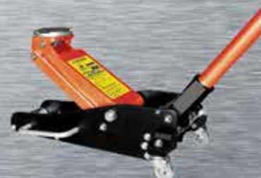
GATOS DE GARAJE