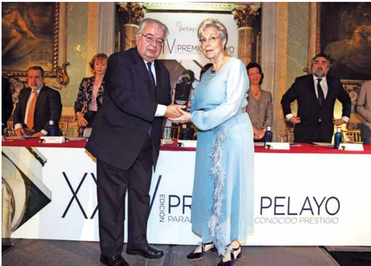
El Presidente del Tribunal Constitucional, D. Juan José González Rivas, hace entrega a Dña. Encarnación Roca Trías, del galardón del XXIV Premio Pelayo para Juristas de Reconocido Prestigio.