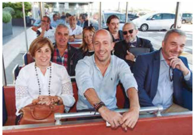
El tren turístico de Santa Susanna, nos trasladó a la tradicional comida con las compañías.