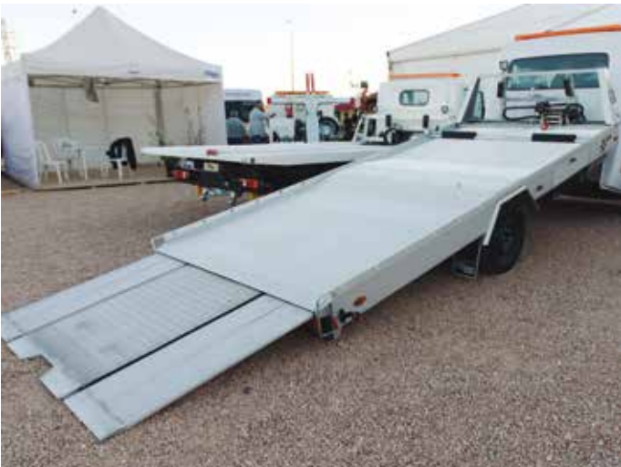
Grúas de Foima.