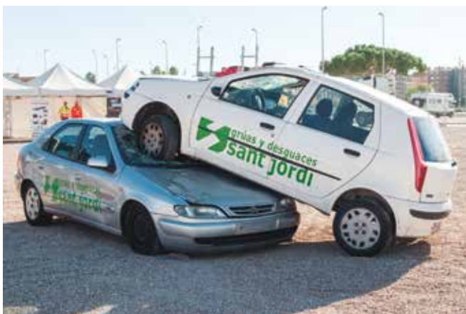
Grúas y Desguaces Sant Jordi, aportó los coches que se utilizaron para el simulacro.