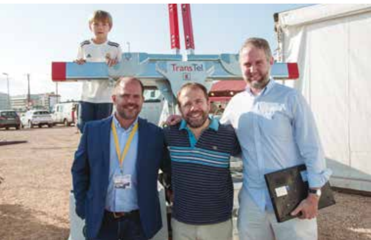
Representantes de TransTel.