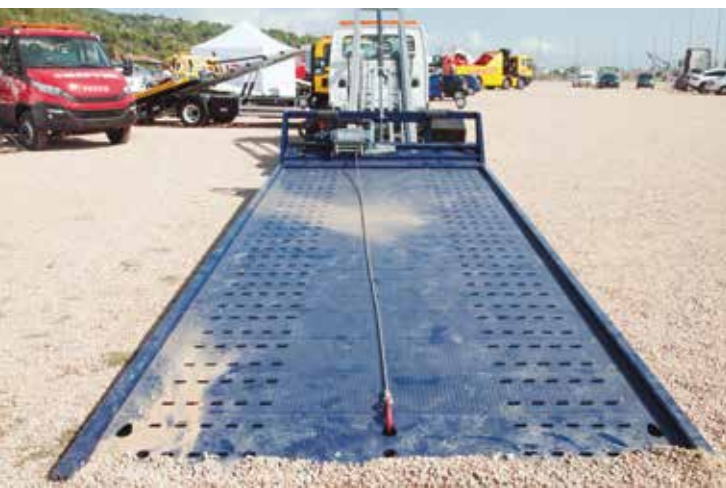
Detalle de una plataforma de Foima.