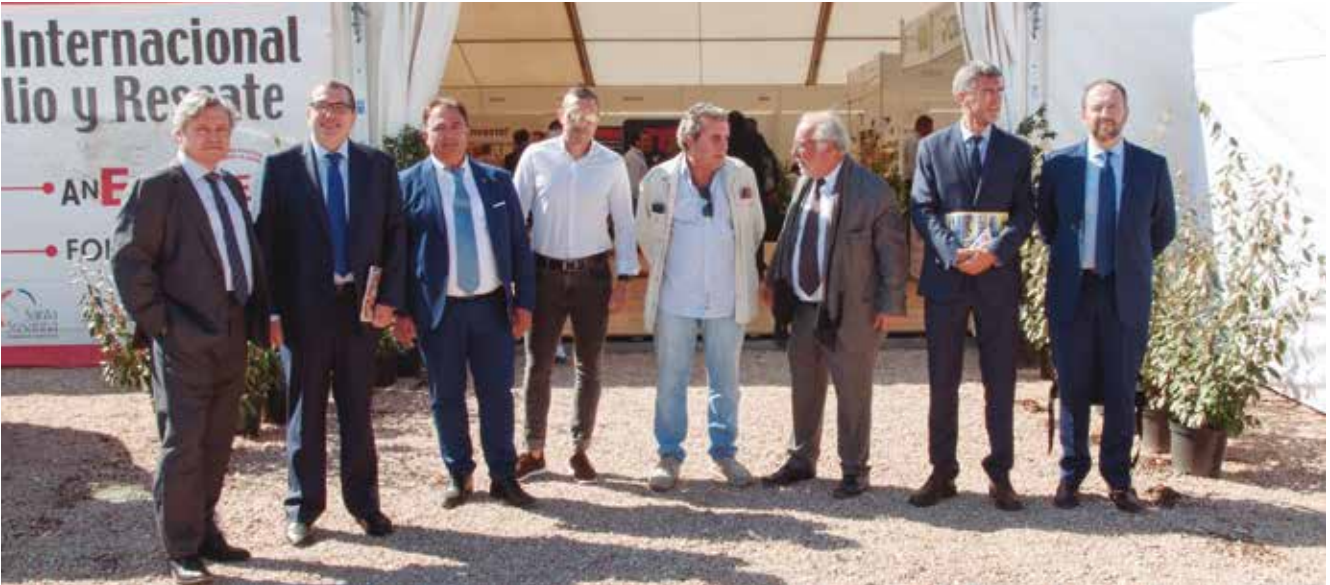
Los participantes en la Jornada de Seguridad Vila, posan en la entrada de la feria.