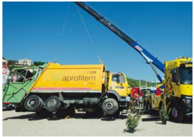
Una grúa de grandes dimensiones de Vemasur, procede a levantar un camión de gran tonelaje.