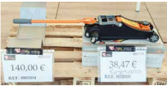
Diferentes productos ofertados por Medicrane.