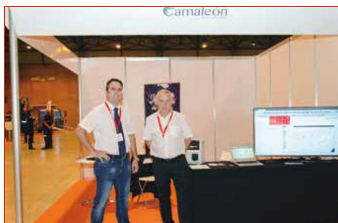
El equipo de Camaleon en su stand.