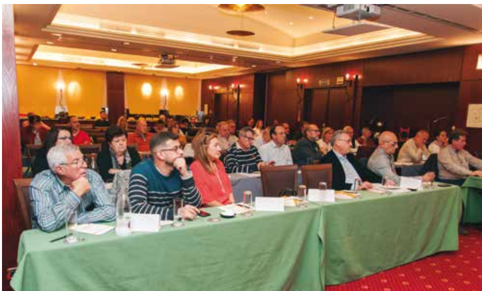
Aspecto de la sala donde tuvo lugar la Asamblea General.

Se realiza una exposición a los socios del estado del proyecto normativo en el ámbito de la Dirección General de Tráfico, describiendo la situación del borrador del Reglamento de Auxilio en Carretera. Es