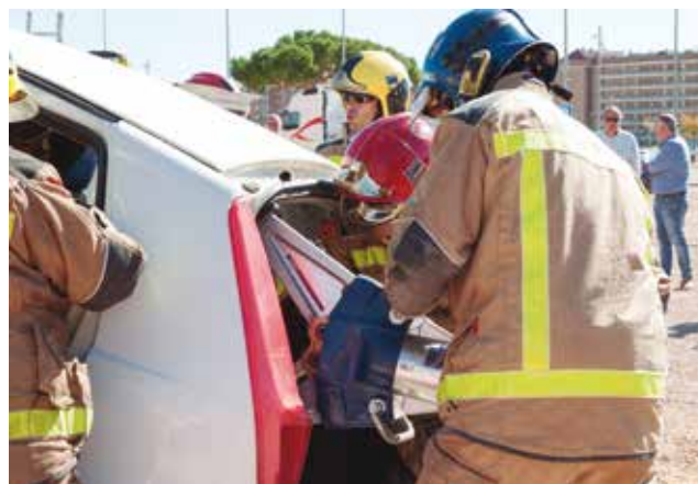
Los bomberos en pleno simulacro de excarcelación.