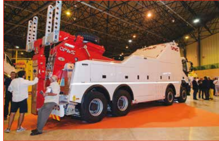
Uno de los impresionantes remolcadores expuestos en FIRECA.