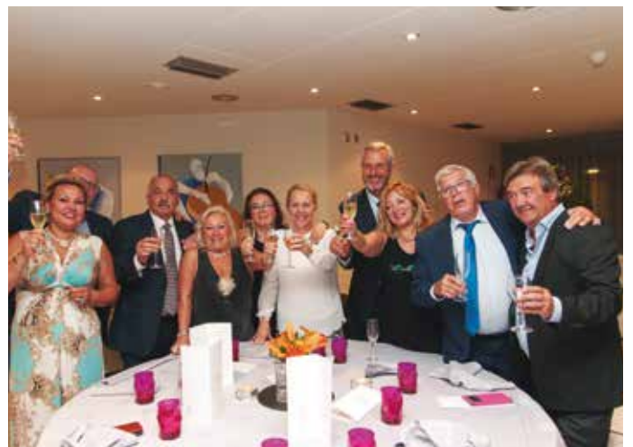
Nuestros socios y amigos brindando por la VIII Edición de la FERIA de ANEAC-FENEAC.