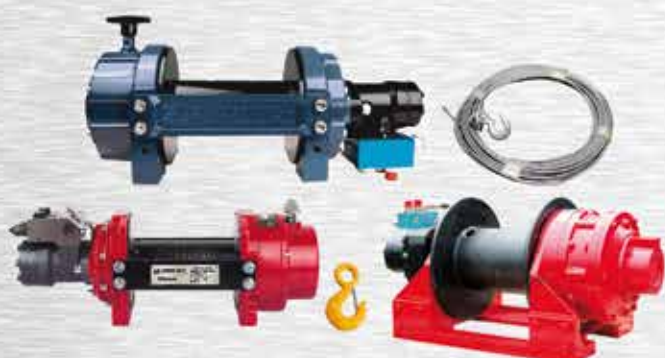
CABRESTANTES ELÉCTRICOS / HIDRÁULICOS