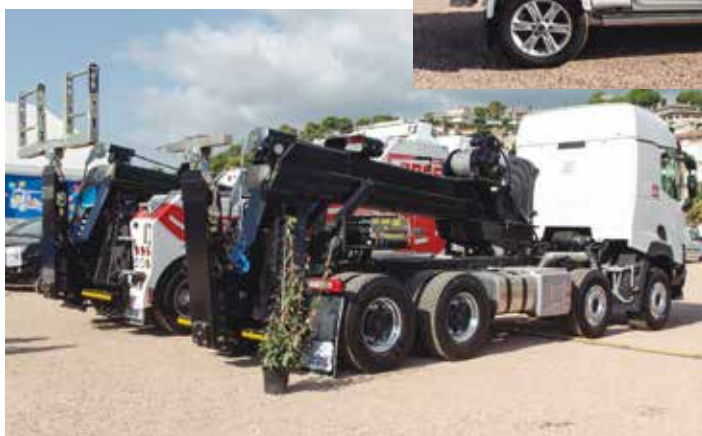
Grúas pesadas de Eurogrúas.