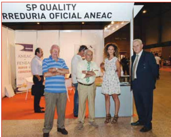
SP Quality, correduría oficial de ANEAC-FENEAC, también estuvo presente en la feria sevillana.

Felicidades a los organizadores por este importante paso para el sector de auxilio en vía pública. Como único punto negativo la mala previsión de fechas, ya que Fireca y la VIII Feria Internacional de Auxilio en Carretera que bianualmente se celebra en San-