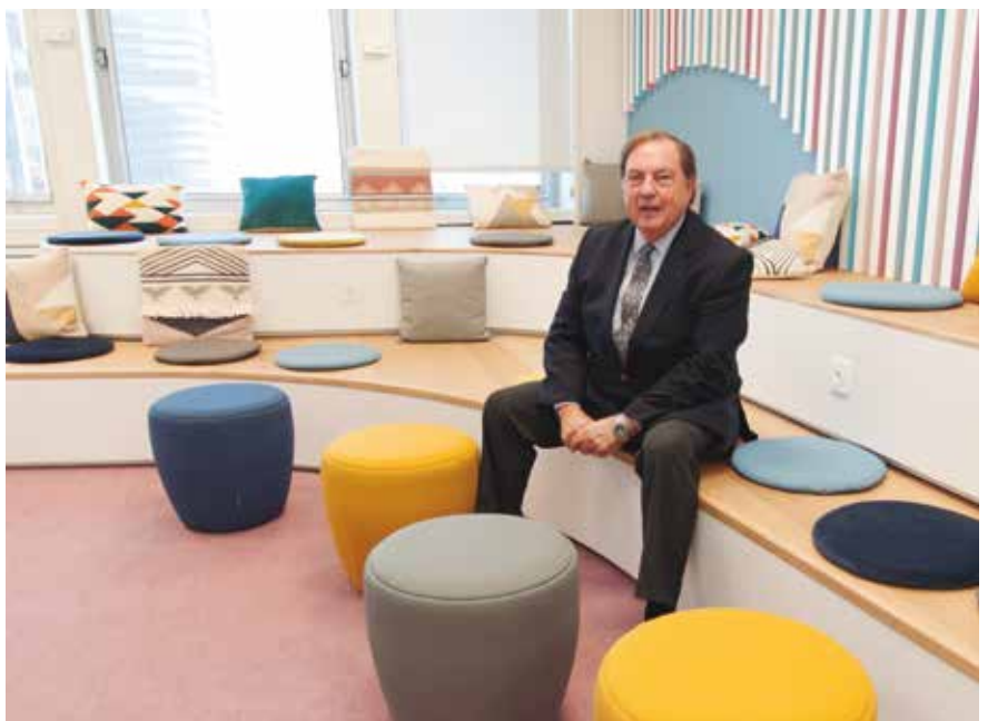
La nueva decoración de las oficinas de Europ Assistance, son diáfanas y alegres.