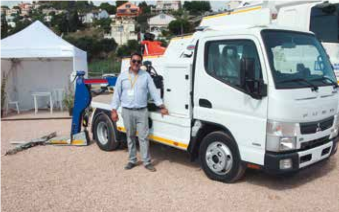
El gerente de Vemasur, con una de sus grúas.