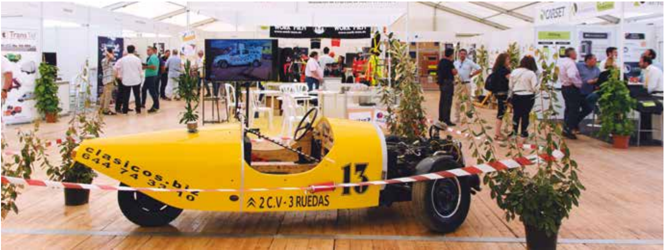
Vista general del interior de la feria.