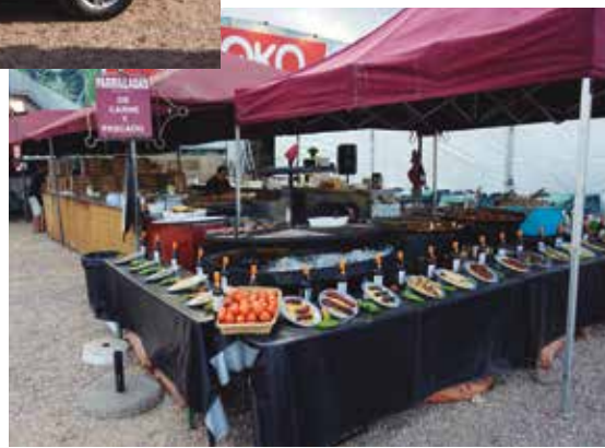
La feria contó con un estupendo bar - barbacoa.