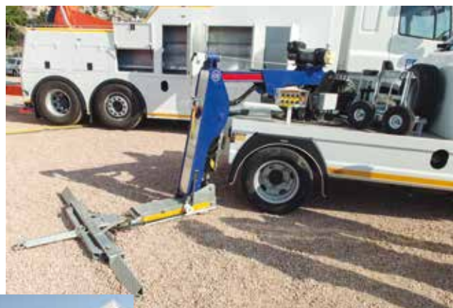
Grúa de palas articulada de Vemasur Hidráulica.