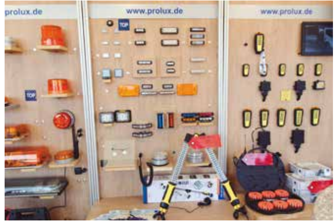
Difentes productos de Neeb-Prolux.