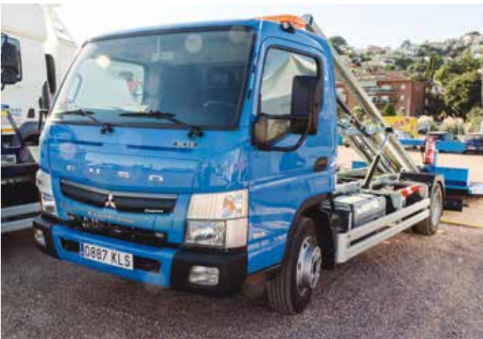
Grúa de Mercedes Fuso.