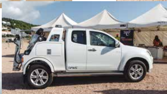
Grúa de Omars delante del stand del Grupo Medicrane.