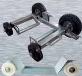
CARROS PORTA VEHÍCULOS