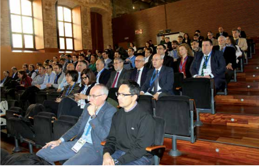
Sesión inaugural del IX Congreso Nacional de Seguridad Vial.

puede explicarse el potencial crecimiento de la siniestralidad que comienza a registrarse en la actual situación de aceleración de nuestra economía.