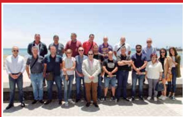
ANEAC-FENEAC viaja a Baleares y Canarias informando al sector sobre el Reglamento de Auxilio en Vía Pública