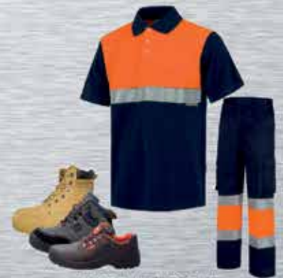
ROPA LABORAL DE ALTA VISIBILIDAD