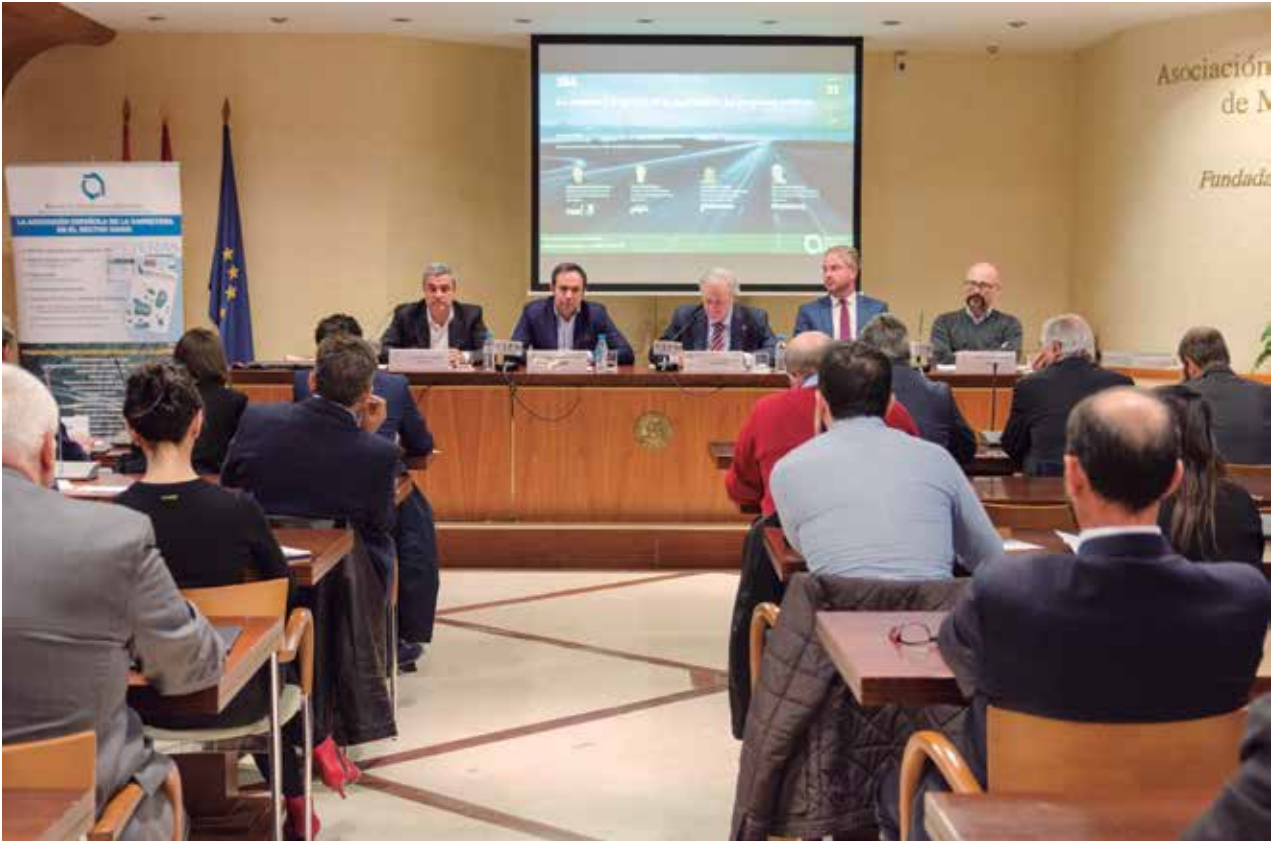
La jornada fue emitida por video conferencia.

los servicios de línea, que se desarrolle a través de aplicaciones móviles o soluciones similares.