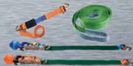
ELEVACIÓN Y AMARRE