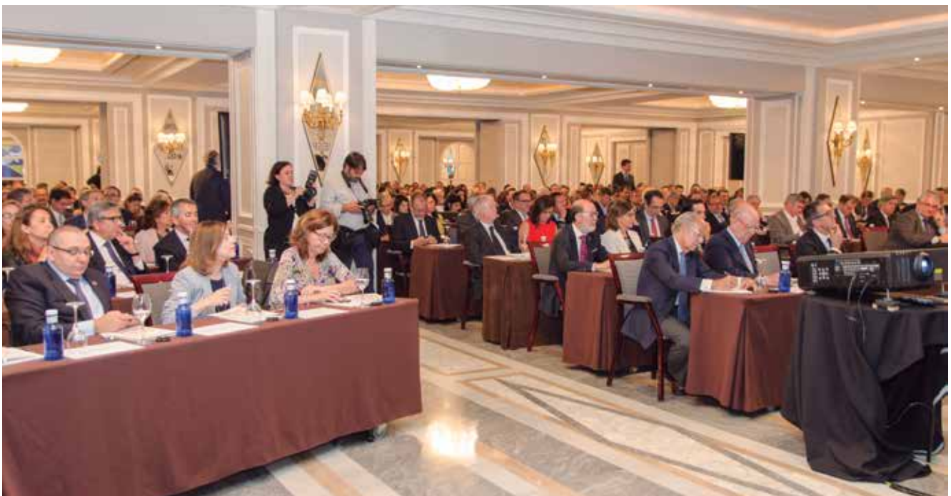
Aspecto de la sala del hotel Villamagna, donde tuvo lugar la presentación del informa.

Otra magnitud que mide el estudio es la huella económica del sector asegurador. Esta se puede calcular desde dos puntos de vista. Por un lado, se puede tomar