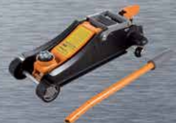
GATOS DE GARAJE