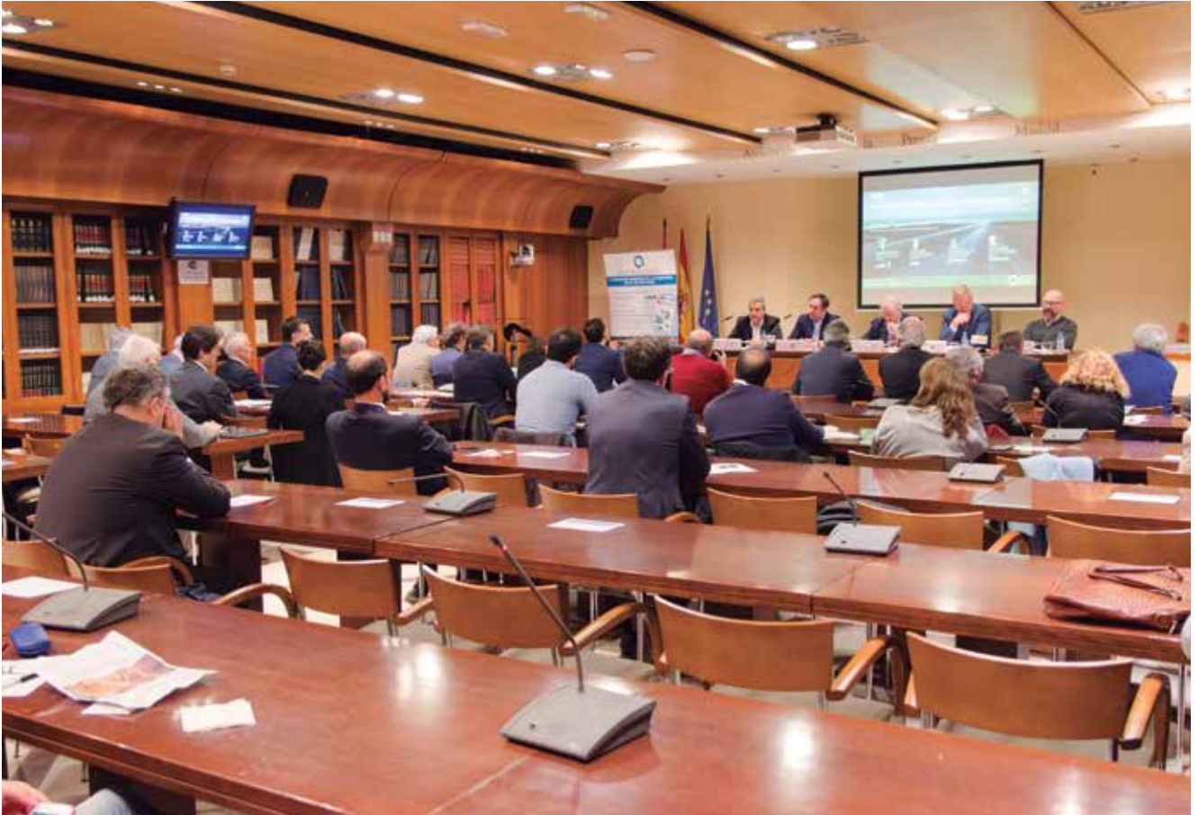
Imagen de la sala de la Asociación de la Prensa de Madrid, donde tuvo lugar la jornada.

tes necesarias para disminuir la accidentalidad. Modernidad, calidad y eficiencia son algunas de las metas que se fija el partido para mejorar las infraestructuras.