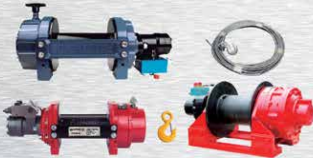
CABRESTANTES ELÉCTRICOS / HIDRAULICOS