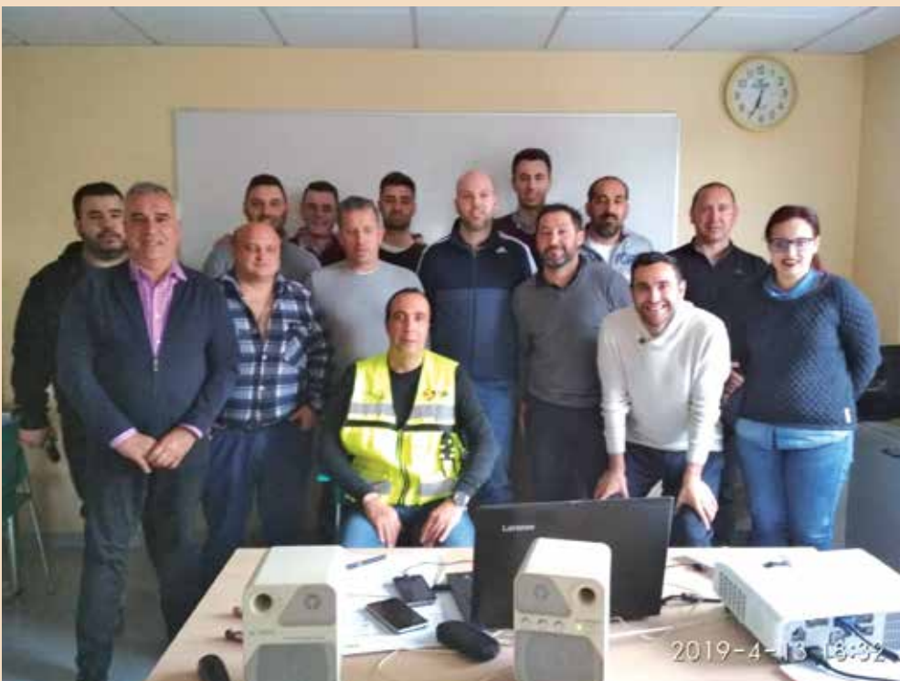
Imagen de los asistentes al curso de formación impartido en Ourense.

Sin más daros la enhorabuena por el curso, que contéis con nosotros para nuevas ediciones y a vuestra disposición para lo que consideréis oportuno.