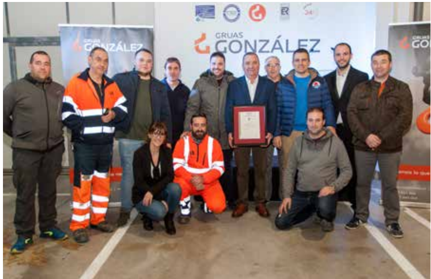
El equipo de Grúas González posa con la certificación.

Por último intervino el consejero de Fomento y Política Territorial, Carlos Cuevas, indicando que la certificación obtenida conlleva una serie de beneficios inmediatos, entre los que destacan, garantizar la seguridad de sus empleados; contribuir a la disminución de las víctimas en accidentes de tráfico; mejorar la productividad y rentabilidad de su negocio al