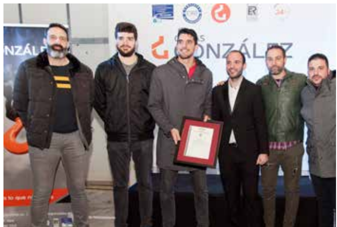
El equipo de balonmano Ciudad de Logroño, patrocinado por Grúas González, también estuvo presente en el evento.