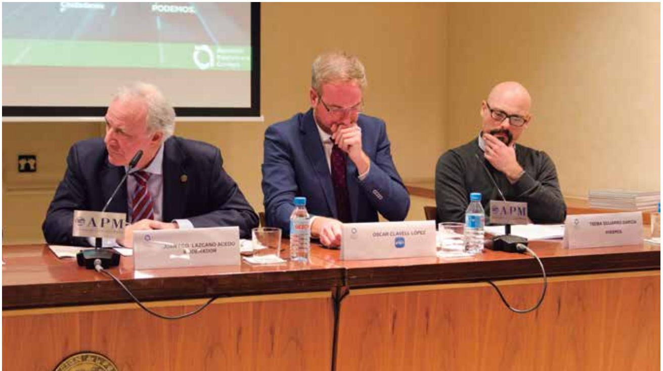
El moderador y presidente de AEC, junto a los representantes del Partido Popular y Podemos.